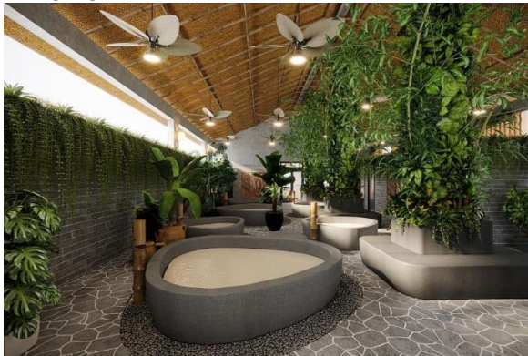
Mô hình dịch vụ tắm onsen và xông Ganbanyoku được chuyển giao công nghệ và vận hành bởi Kawara Resort (Thôn Mỹ An, Xã Phú Dương, Huyện Phú Vang, Tỉnh Thừa Thiên Huế, Việt Nam)

tấn công của Covid-19, sức khỏe càng là mối quan tâm số một, vừa đi du lịch và chăm sóc sức khỏe đang trở thành xu hướng tất yếu. Xu hướng nghỉ dưỡng hoặc khám phá điểm mới theo nhóm nhỏ lên ngôi. Chẳng phải ngẫu nhiên mà khi vừa ra mắt cách đây không lâu, khu nghỉ dưỡng suối khoáng nóng cao cấp Yoko Onsen Quang Hanh (Cẩm Phả) ngay lập tức là điểm đến “hot” bậc nhất tại Quảng Ninh hay Makazuki Japanese Resort and Spa tại Đà Nẵng cũng thế. Vì vậy, khi đại dịch được kiểm soát, khách du lịch sẽ tìm kiếm những chuyến đi nghỉ dưỡng phục hồi sức khỏe sau thời gian dài bị kìm nén nhu cầu du lịch, cũng như tìm đến sự “thư thái” đúng nghĩa cả về vật chất lẫn tinh thần.