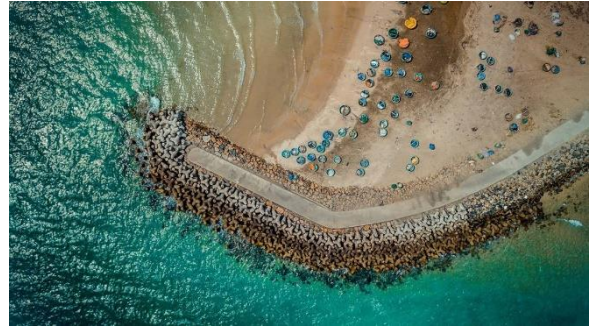
Biển mũi né

Minh - Phan Thiết - Bình Thuận - Nha Trang, cũng là lựa chọn được ưu ái.