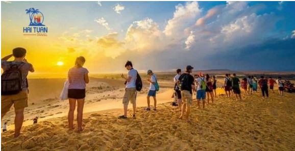
Biển mũi né

Trước khi đại dịch diễn ra, việc tổ chức mua tour du lịch cùng bạn bè và người thân để khám phá một thành phố đông đúc, một di tích lịch sử lâu đời, hay một danh lam thắng cảnh nổi tiếng dường như là một điều rất đỗi bình thường, nhất là trong thời đại mà nhu cầu dịch chuyển và đi lại phát triển mạnh mẽ như hiện nay. Việc dạo bước trên những bãi biển đầy nắng vàng, cát trắng; lang thang qua các khu chợ nhộn nhịp, thưởng thức bữa tối tại các nhà hàng sang trọng hay ngay tại quán ăn bình dân địa phương, hàng ăn vỉa hè là những hoạt động không thể thiếu trong mỗi chuyến hành trình.