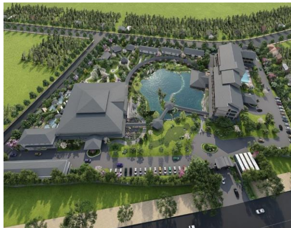
Khu nghỉ dưỡng phục hợp và chăm sóc sức khỏe theo tiêu chuẩn onsen Nhật Bản truyền thống tại Việt Nam (Kawara Resort, Thôn Mỹ An, Xã Phú Dương, Huyện Phú Vang, Tỉnh Thừa Thiên Huế, Việt Nam)