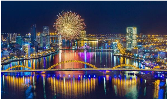
Đà Nẵng ngày càng chuyển mình, thêm cuốn hút và thơ mộng với những đêm không ngủ

Cụ thể hơn, theo Booking: "Trong năm 2020, quãng đường du lịch trung bình mà người Việt Nam đi là 629 km cho mỗi lượt đặt phòng. Mặc dù con số này giảm so với mức 932 km cho mỗi lượt đặt phòng của năm ngoái, nhưng khoảng cách ngắn hơn không có nghĩa là hạnh phúc sẽ vơi đi". Trên thực tế, du khách người Việt vẫn dành sự ưu ái và quan tâm đối với các thành phố lớn và các điểm du lịch nổi tiếng như: Sapa (Lào Cai), Hà Nội, Hạ Long, Huế, Đà Nẵng, Nha Trang, Vũng Tàu, Tp. Hồ Chí Minh, Phú Quốc và Đà Lạt... hoặc dành thời gian trải nghiệm một số địa điểm tại chính nơi ở của họ. Sự chuyển dịch này thúc đẩy những nhà cung cấp trong ngành cần có những kế hoạch tiếp cận và thiết kế những sản phẩm có khả năng đáp ứng được các nhu cầu du lịch của nhóm du khách này.