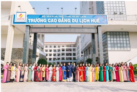
Cán bộ nhân viên trường Cao đẳng Du lịch Huế trong ngày Quốc tế Phụ nữ 8/3

Thứ năm: Đoàn kết, gương mẫu trong thực hiện nhiệm vụ.