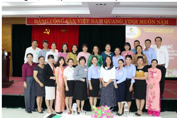
Hội giảng nhà giáo giáo dục nghề nghiệp Trường năm 2021

Khi mới thành lập, toàn trường chỉ có 31 viên chức, giảng viên, giáo viên và nhân viên, trong đó có 01 Tiến sĩ, không có thạc sĩ. Đến nay, tổng số viên chức, giảng viên, giáo viên và nhân viên là 130 người, trong đó, 02 Tiến sĩ, 61 thạc sĩ (01 nghiên cứu sinh). Hơn 20 năm qua, nhà trường đã phát triển được đội ngũ cán bộ, giáo viên có kiến thức sâu về chuyên môn, kỹ năng làm việc và kỹ năng nghề thành thạo, hiệu quả gắn với từng vị trí việc làm, tiêu chuẩn chức danh nghề nghiệp. Đến nay, đội ngũ viên chức, giảng viên, giáo viên của trường có khả năng giảng dạy cả lý thuyết và thực hành, có phương pháp dạy nghề phù hợp, sử dụng thành thạo tiếng Anh và tiếng Pháp trong giao tiếp, nghiên cứu tài liệu tham khảo phục cho công tác giảng dạy cũng như quản lý. Đặc biệt, có 25 giáo viên đủ năng lực dạy các môn chuyên ngành bằng tiếng Anh như Lễ tân, Nhà hàng, Buồng, Quản trị khách sạn, Quản trị khu Resort, Quản trị nhà hàng, Quản trị Lễ hành, Hướng dẫn du lịch và Kỹ thuật Chế biến món ăn đáp ứng được yêu cầu của trường đào tạo du lịch chất lượng cao, phù hợp với xu hướng hội nhập ASEAN và quốc tế.