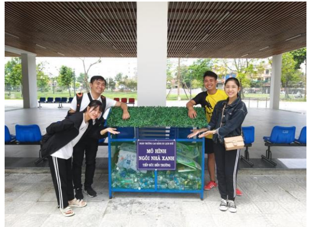
Hình 3. Mô hình Ngôi nhà xanh – một sáng kiến có sự tham gia của HSSV

trình” liên quan đến hoạt động NCKH, dù có kết quả cao hay không thì việc tuyên dương đúng lúc cũng sẽ là động lực để các bạn tự tin hơn khi tham gia NCKH. Giải pháp này không chỉ là nền tảng động lực mà nó sẽ góp phần giúp lan tỏa và thúc đẩy phong trào tham gia NCKH trong nhóm, trong mỗi lớp học hiệu quả hơn;