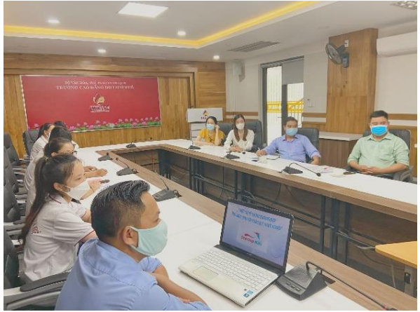
Hình 1. Chùm ảnh cuộc thi ý tưởng khởi nghiệp HSSV giáo dục nghề nghiệp

Hai là, tạo phong trào NCKH trong HSSV bằng cách tổ chức nhiều hơn và thường xuyên hơn các sân chơi khoa học như: Các Hội thi sáng tạo khoa học, Sân chơi trí tuệ như rung chuông vàng và các CLB NCKH nhằm thu hút HSSV tham gia, chia sẻ, học hỏi kinh nghiệm, kiến thức; Tăng cường tổ chức các buổi tọa đàm trao đổi nhằm giới thiệu, trang bị cho HSSV những phương pháp học tập, nghiên cứu đúng đắn; bồi dưỡng nhiều hơn các kỹ năng NCKH, kỹ năng mềm trong các hoạt động ngoại khóa và chính khóa liên quan đến hoạt động NCKH. Đa số HSSV thường nghĩ hoạt động NCKH là cao siêu, ngoài tầm với và chỉ dành cho những HSSV xuất sắc. Có không ít các bạn HSSV chưa hiểu rõ NCKH là như thế nào, không biết bắt đầu từ đâu hay nghiên cứu những gì. Chính vì thế, cần có những sân chơi, những hoạt động thúc đẩy tuyên truyền, đưa các thông tin về NCKH đến gần với HSSV hơn nữa, làm cho mỗi HSSV đều tự ý thức được tầm quan trọng của hoạt động NCKH và NCKH không phải là một hoạt động xa vời mà rất thiết thực với bản thân HSSV;