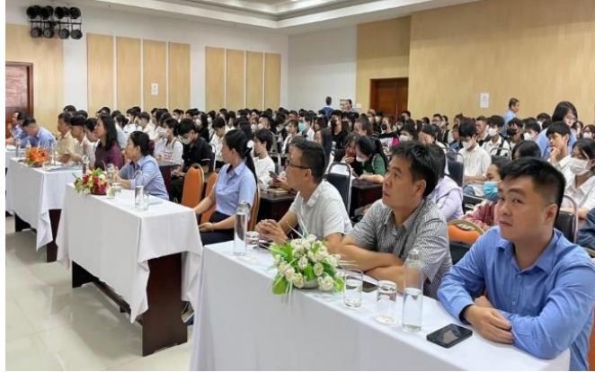
Tuần sinh hoạt công dân của HSSV HUETC

Hồ Chí Minh coi giáo dục nâng cao trình độ, chính trị, văn hóa, khoa học, công nghệ và kỹ thuật là điều kiện quan trọng đoàn viên thanh niên cống hiến ngày càng nhiều cho Tổ quốc cho nhân dân.