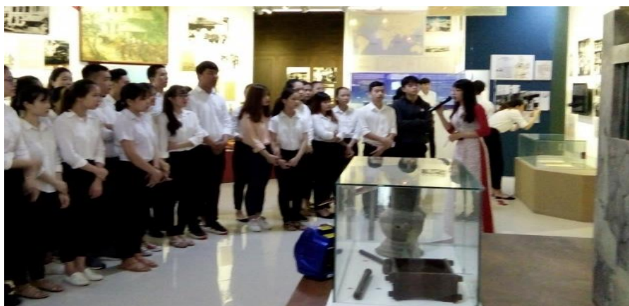
HSSV HUETC tham quan Bảo tàng Hồ Chí Minh

Thứ nhất , giáo dục chủ nghĩa yêu nước cho đoàn viên thanh niên. Trong số những vấn đề cần giáo dục cho đoàn viên thanh niên, Hồ Chí Minh đặt lên hàng đầu đó là giáo dục chủ nghĩa yêu nước. Với đoàn viên thanh niên, “Trước hết phải yêu Tổ quốc, yêu nhân dân. Phải có tinh thần dân tộc vững chắc và tinh thần quốc tế đúng đắn”. Chủ nghĩa yêu nước là vốn quý, là sức mạnh to lớn giúp dân tộc ta đứng vững trước những thử thách nghiệt ngã trong lịch sử. Chủ nghĩa yêu nước được hun đúc từ bao đời và đã trở thành sức mạnh, biểu tượng Việt Nam. Ngày nay, trong thời đại Hồ Chí Minh, hơn bao giờ hết, tinh thần ấy cần được đề cao và khơi dậy một cách mạnh mẽ để đưa chúng ta vượt qua đói nghèo, tụt hậu. Người nhấn mạnh “Lòng yêu nước và sự đoàn kết của nhân dân là một lực lượng vô cùng to lớn, không ai thắng nổi”. Có thể khẳng định rằng, giáo dục chủ nghĩa yêu nước cho đoàn viên thanh niên theo tư tưởng Hồ Chí Minh là việc làm đặc biệt quan trọng trong bối cảnh hiện nay, nó tiếp thêm nguồn sức mạnh, trí sáng tạo cho hàng triệu thanh niên đang ngày đêm chiến đấu, lao động, cống hiến trên mọi lĩnh vực vì sự vững bền của đất nước, cho sự thăng hoa của dân