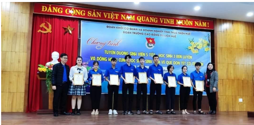
HSSV HUETC được tuyên dương Sinh viên 5 tốt

đoàn viên thanh niên, Hồ Chí Minh đã kế thừa tư tưởng văn hóa phương Đông “nhân trị, đức trị” của Khổng Tử, Mạnh Tử; tư tưởng pháp trị của Tuân Tử, Hàn Phi Tử, Người viết: “ Gạo đem vào giã bao đau đớn, Gạo giã xong rồi, trắng tựa bông; Sống ở trên đời người cũng vậy, Gian nan rèn luyện mới thành công ”. Có thể nói, theo Hồ Chí Minh để rèn luyện bản chất cho thanh niên, rèn luyện khí phách của người cách mạng, người cộng sản thì không phải trong sự nhàn rỗi, trong sự ngồi không để hưởng thụ, mà là phải trong gian nan thử thách, trong đấu tranh cách mạng.