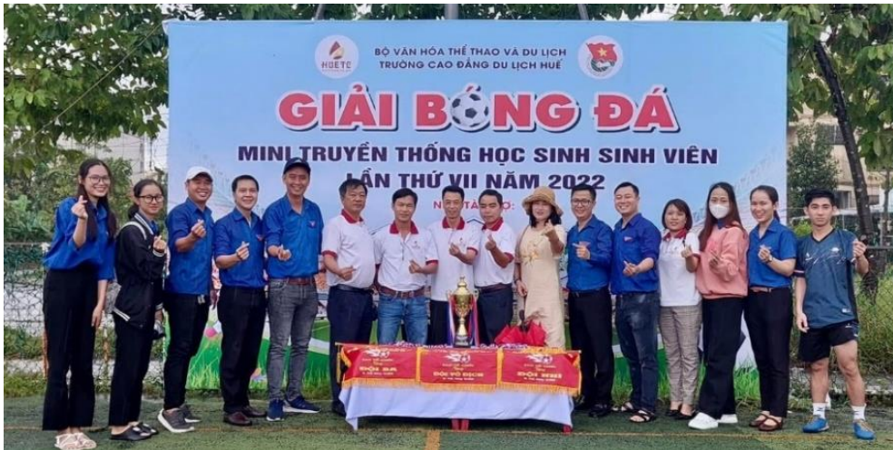
Sinh viên trường Cao đẳng Du lịch Huế tham gia giải bóng đá Mini truyền thống Học sinh – sinh viên năm 2022

Sau cách mạng tháng Tám 1945, ngay lập tức Người đã chỉ đạo nhân dân “thực hiện đời sống mới”, chống các tệ nạn xã hội (như cờ bạc, rượu chè, ma túy, mê tín dị đoan... Đặc biệt đối với thế hệ trẻ Hồ Chí Minh có yêu cầu cao trong quá trình rèn luyện, tạo dựng cho bản thân nếp sống văn hóa, đấu tranh chống lại “tâm lý ham sung sướng, tránh khó nhọc”, “chống lười biếng, chống xa xỉ, chống kiêu ngạo khoe khoang, chống sinh hoạt ủy mị vô kỷ luật”. Trong thời đại mới phải kế thừa và phát triển mô hình con người người toàn diện của Hồ Chí Minh, ngăn chặn có hiệu quả sự xuống cấp về đạo đức, lối sống, đẩy lùi tiêu cực xã hội và các tệ nạn xã hội. Bảo vệ và phát huy các giá trị tốt đẹp, bền vững trong truyền thống văn hóa Việt Nam, là thước đo trình độ phát triển người, làm cho con người phát triển toàn diện chân - thiện - mỹ, thấm nhuần tính dân tộc, nhân văn.